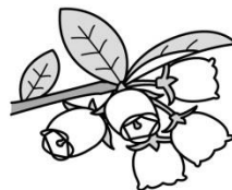
ブルーベリーの花